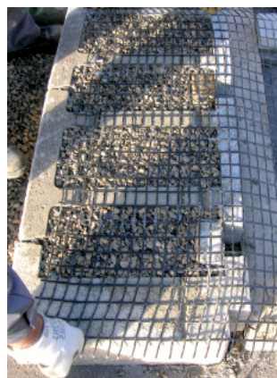
Géogrille (mise en place)